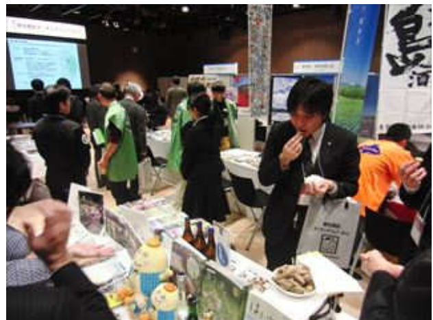
観光商談マッチングフェア2015